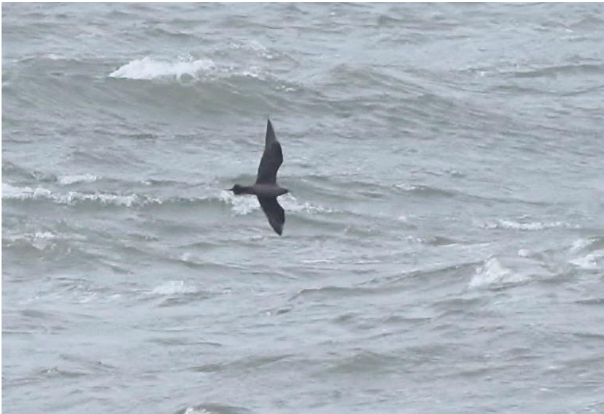
Kleine jager (donkere fase)

Zeetrekters kijken altijd uit naar het najaar. Menig weerbericht wordt nauwlettend in de gaten gehouden. Vooral naderende depressies op de Atlantische oceaan kunnen langs de kust voor stormachtige periodes zorg dragen. Deze lage drukgebieden zorgen doorgaans voor een stevige wind vanuit het zuidwesten. Soms naderen deze stormvelden vanuit het westen, dus direct op de Hollandse kust. Tijdens dergelijke weersomstandigheden worden zeevogels naar de kust geblazen en komen zodoende in het vizier van de vogelspotters. Dit zijn van die dagen dat menige zeetrekter handenwrijvend met telescoop of verrekijker de zee afspeurt naar mogelijke bijzonderheden.