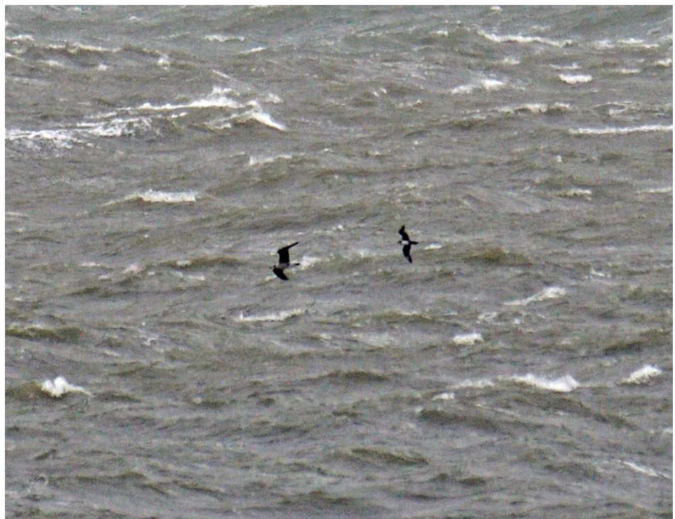
Kleine Jager (lichte fase)

Niet alleen de harde aanlandige wind is een belangrijke factor in het ruimtelijke patroon van hun voorkomen die daarmee samenhangt. Er bestaat zeker een correlatie met de aanwezigheid van 'noordse dieven' in de kustzone. In jaren met veel kleine jagers is er in zekere zin een positief verband tussen het uurgemiddelde van kleine jagers en dat van 'noordse dieven'. De voedselsituatie hangt dus af door de aanwezigheid van visetende sterns en kleine meeuwen. Ze vallen al op grote afstand op door het opvallende en volhardende jagen achter meeuwen en sterns aan, met als doel om hen van hun voedsel te beroven. Kenmerkend voor kleine jagers is de stevige, valkachtige vlucht met lange, spitse vleugels.