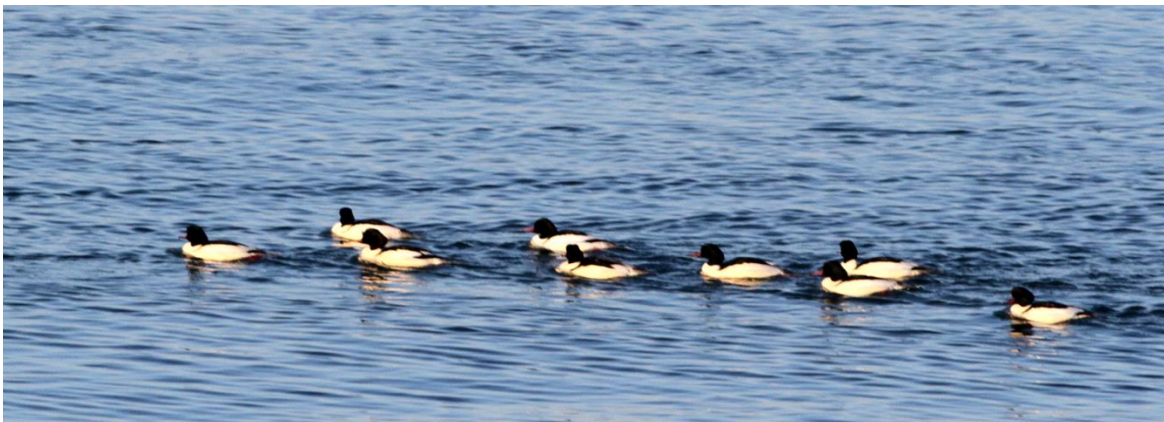
Grote zaagbekken

Een winter die geen winter was. Zo vallen de weerskarakteristieken voor deze maand in het kort te omschrijven. Hierdoor was het overwinteringsgebied voor de vele eenden en ganzen noordelijker dan gebruikelijk. Dit is uiteindelijk in een langjarige statistiek terug te vinden.